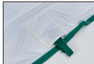
Spenner i lommer