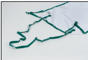
Ekstra lange slepestrapper